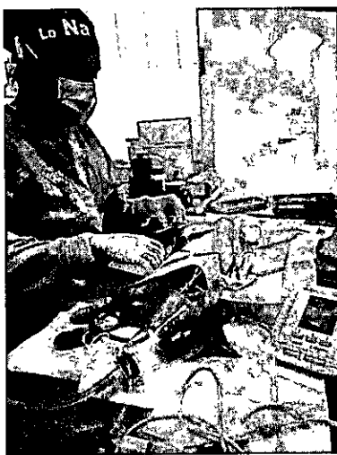
Cirugía de esterilización de hembra felina.