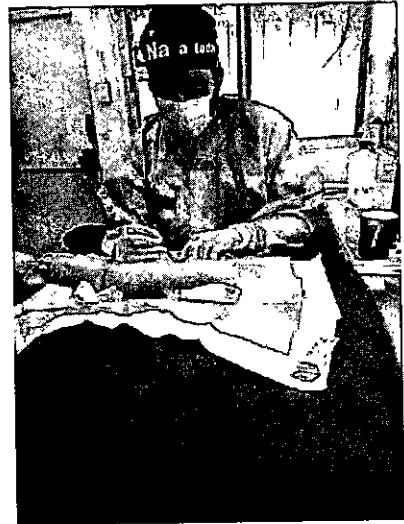
OVH en hembra canina.