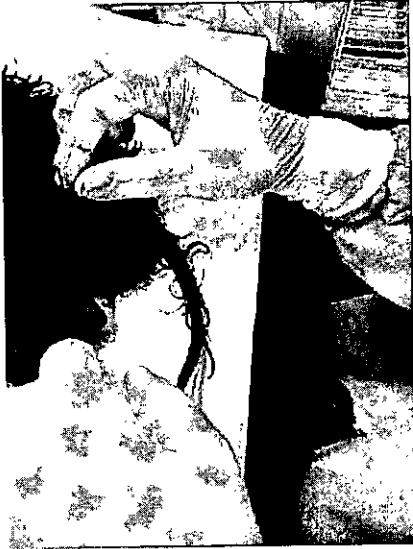
Prolapso rectal en hembra canina.